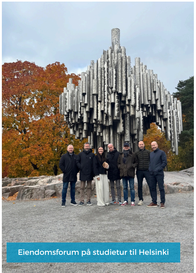
Eiendomsforum på studietur til Helsinki