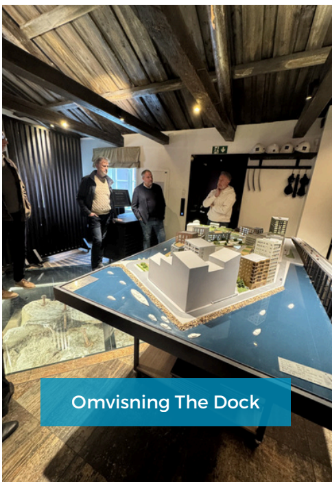
Omvisning The Dock