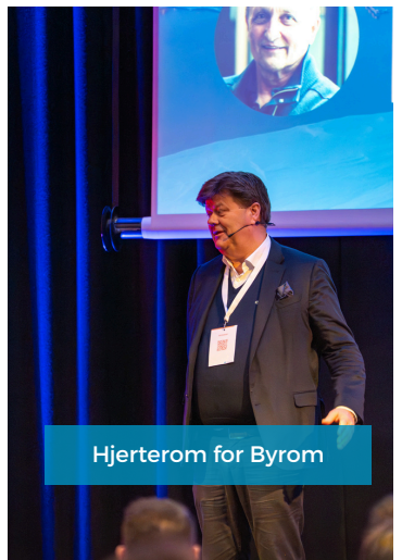
Hjerterom for Byrom