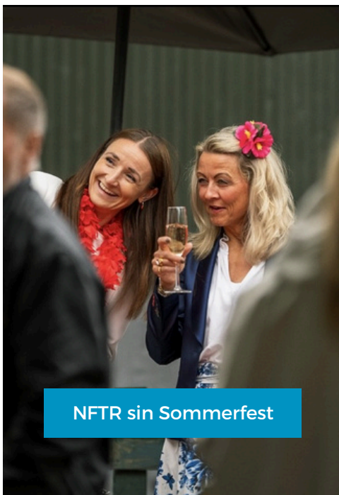
NFTR sin Sommerfest