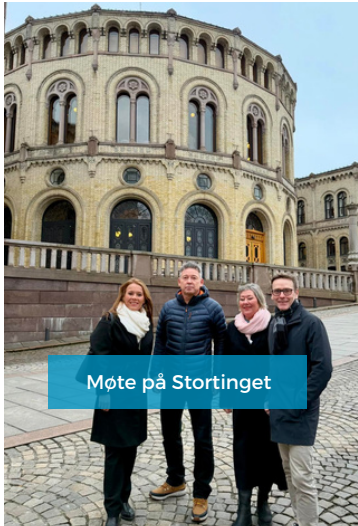
Møte på Stortinget