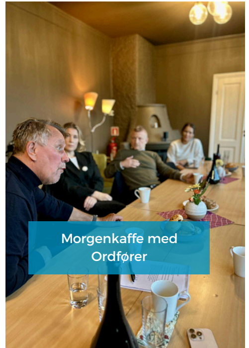
Morgenkaffe med Ordfører