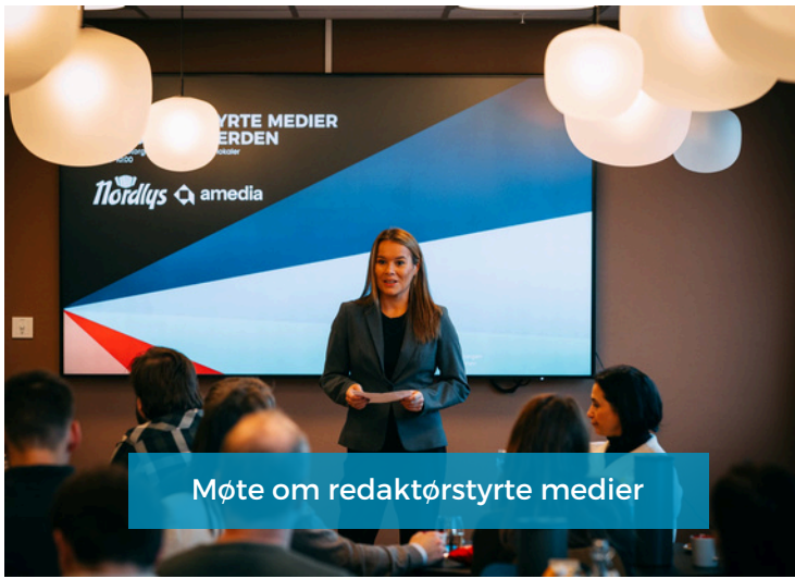
Møte om redaktørstyrte medier