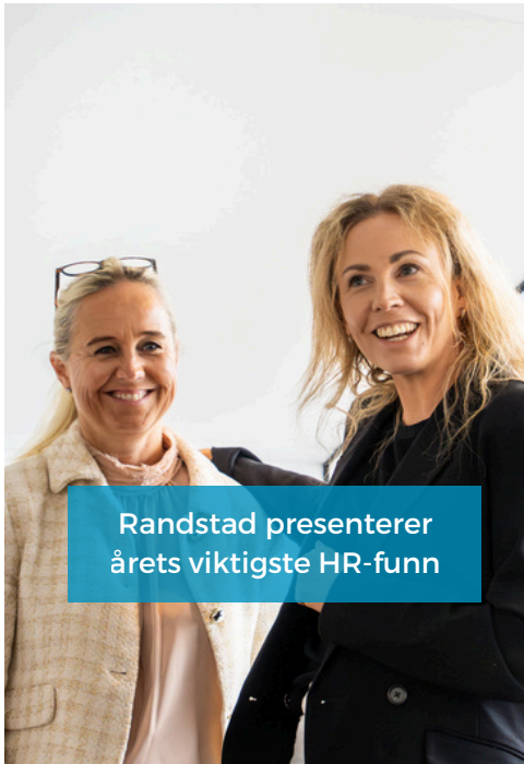
Randstad presenterer årets viktigste HR-funn