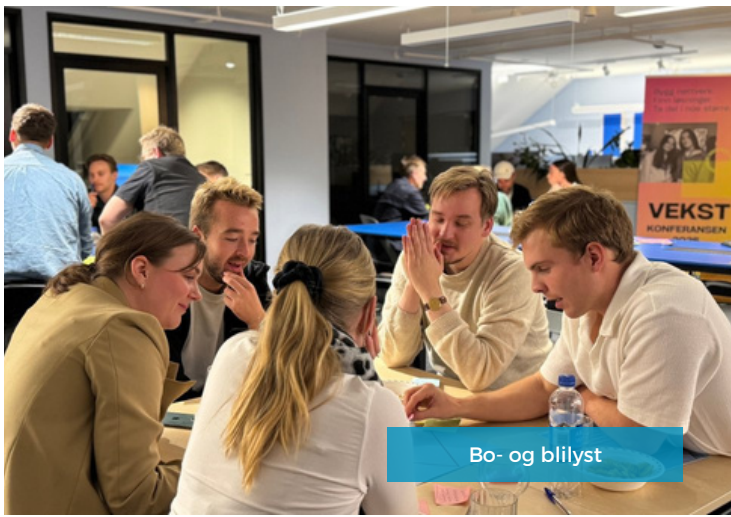
Bo- og billyst