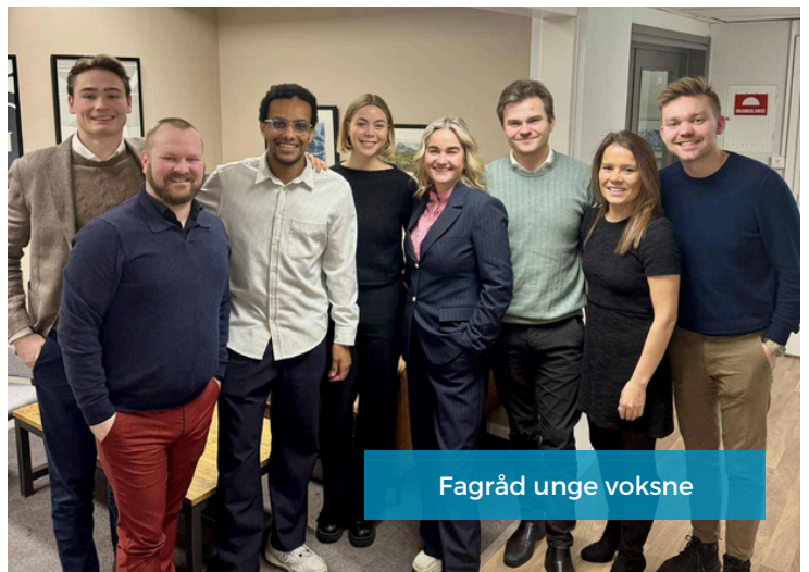
Fagråd unge voksne