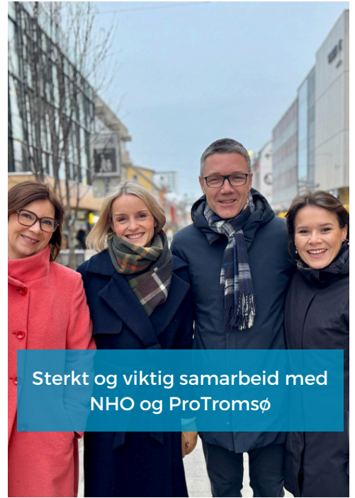
Sterkt og viktig samarbeid med NHO og ProTromsø