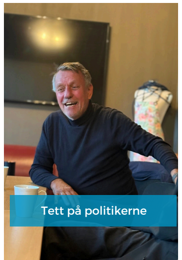
Tett på politikerne