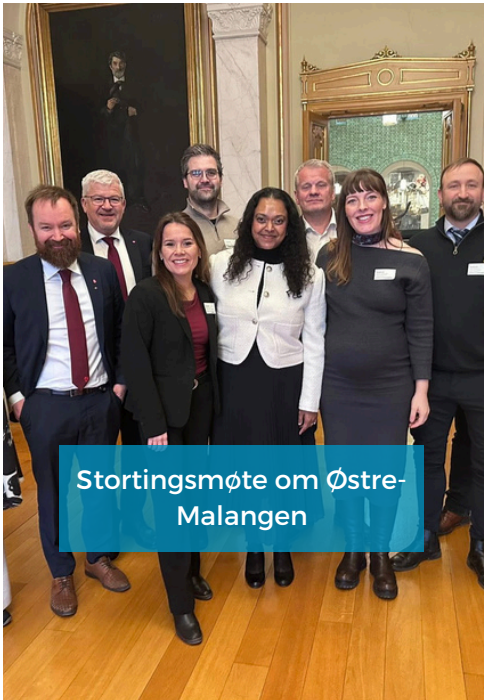
Stortingsmøte om Østre-Malangen